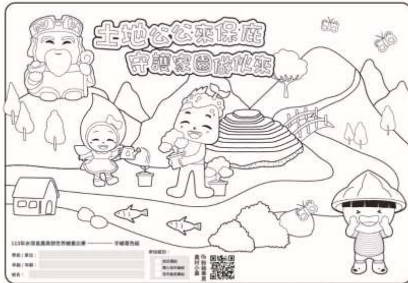
▲(個人)手繪著色圖稿